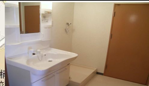
洗面台、流し台、吊戸、下駄箱交換済