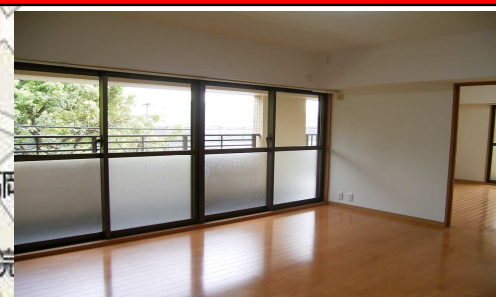
照明取替、加え、畳、フローリング張替、明るい室内