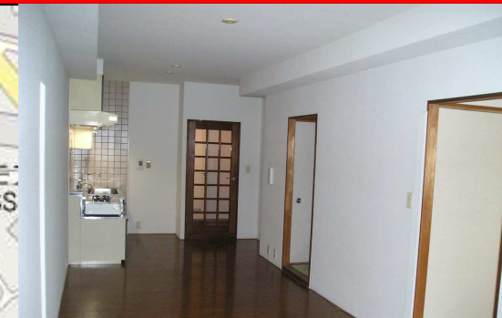
リビング奥から玄関方面、左手がキッチンです