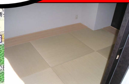
1つは欲しい和室、琉球畳風の作りです