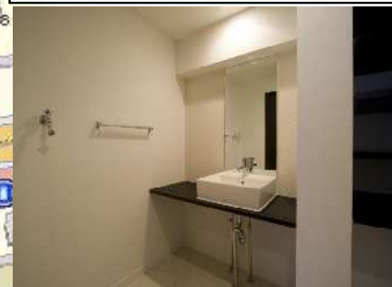
ちょっとおしゃれな洗面台(新品)に取替済