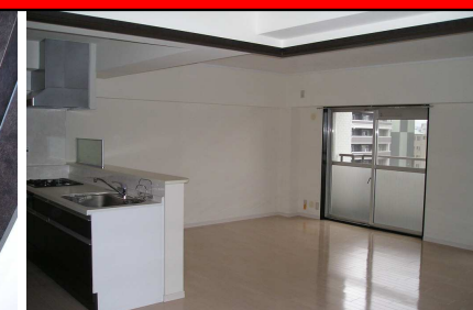
バルコニー南向き、システムキッチン交換済み、広いリビング