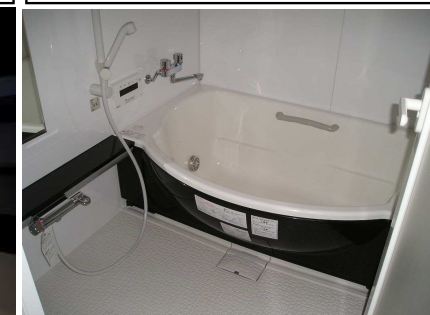
追焚き付バスバ新製品交換済、お年寄りにもやさしい