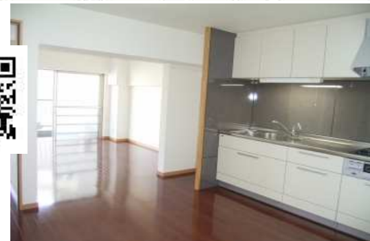
建具、クロス、フローリング張替、エアコン付