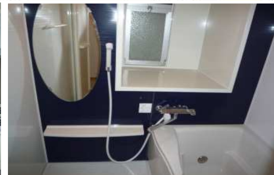
システムキッチン、洗面台、ウオシュレット、バス、下駄箱交換済